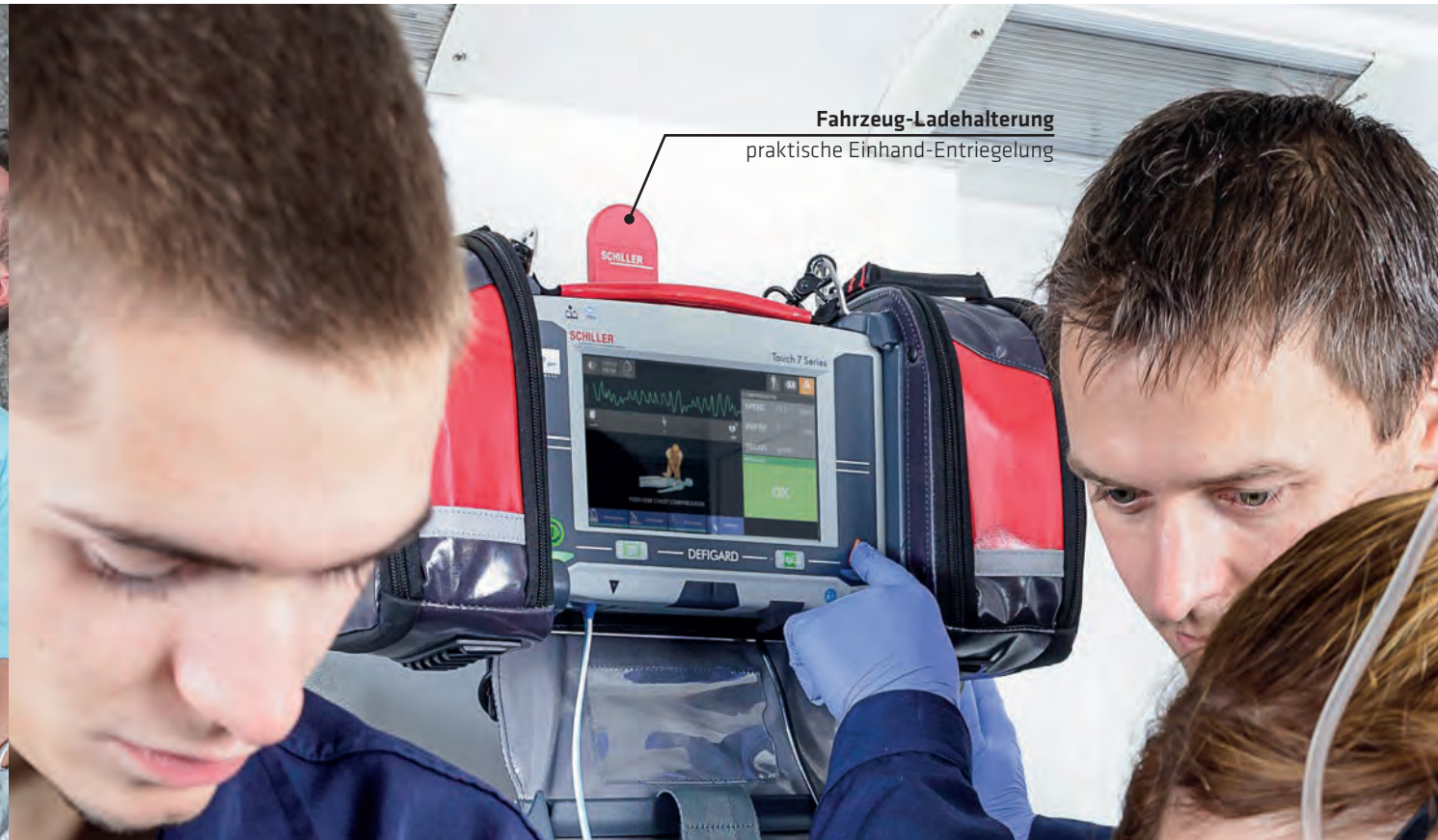
Fahrzeug-Ladehalterung praktische Einhand-Entriegelung